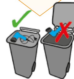
Auf den Deckel der Grauen o. Braunen Tonne